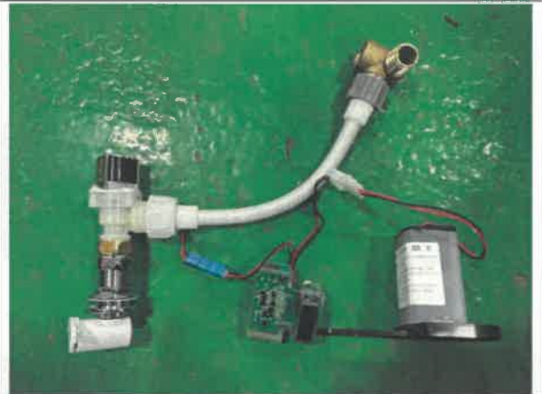
RWU960-B(세척밸브 : 94318, 배터리식)