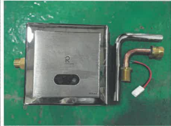
RWU928(세척밸브 : RUE432, 전기식)